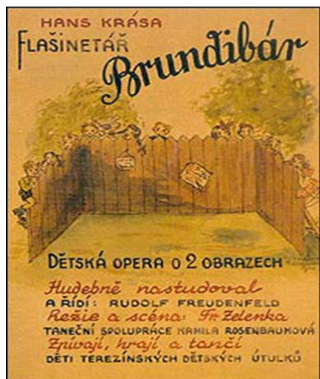
Immagine della locandina originale con il bozzetto della scenografia di Frantisek Zelenka.

Questa è la storia triste e luminosa della piccola partitura manoscritta di un'opera per voci bianche, infilata di fretta dal musicista